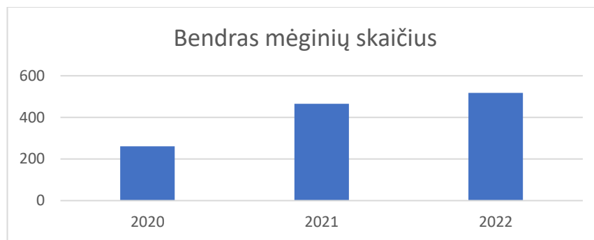
Grafikas Nr.1. Bendras mėginių skaičių 2020 – 2022 m.

23. Testavimų vykdymui Agentūra bendradarbiauja su 11 dopingo kontrolės pareigūnų (iš jų – 2 kraujo dopingo kontrolės pareigūnai). Dopingo kontrolės pareigūnus atrenka, apmoko ir akredituoja Agentūros darbuotojai. Reakreditacija vyksta, kas 2 metus. Dopingo kontrolės pareigūnams keliami aukšti reikalavimai, kurie susiję ne tik su dopingo kontrolės procedūros, antidopingo sistemos išmanymu, bet ir aukšta bendravimo kultūra, gerais užsienio kalbos įgūdžiais, sąžiningumu ir pan., įvertinus šiuos poreikius Agentūra nuolat organizuoja mokymus, siekiant, kad pareigūnai keltų kvalifikaciją ne tik antidopingo srityje.